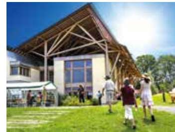
La Damassine, maison des vergers, du paysage et de l'énergie 🕒 1h30 📍 Vandoncourt

Balade à l'ombre de saules centenaires, au gré des allées bordées de somptueux massifs fleuris, entre les berges de l'Allan et celles du canal du Rhône au Rhin. Votre guide vous conduira au cœur de l'aventure scientifique de ce parc: Fontaine Galilée, pendule de Foucault, cadran solaire géant... et de celui qui le prolonge: l'île en Mouvement, dédié au mouvement et à sa perception.