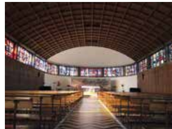
L'église du Sacré-Coeur 🕒 1h30 📍 Audincourt

Cette église est l'une des premières églises construites en béton armé de France (1932), par le moine et architecte Dom Bellot. La Maison du Patrimoine des Forges à côté de l'église, raconte quant à elle l'épopée des Forges d'Audincourt, du début du XVII e siècle à 1971.