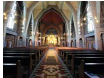
L'église de l'Immaculée-Conception au sein du quartier des forges et la Maison du Patrimoine 🕒 1h30 📍 Audincourt

Cette œuvre majeure de la renaissance germanique, construite de 1601 à 1607 par Heinrich Schickhardt, est le plus ancien édifice français affecté au culte de la Réforme. La visite se poursuit au musée d'art et d'histoire - Hôtel Beurnier-Rossel avec la collection d'orfèvreries luthériennes déposées par les paroisses protestantes du Pays de Montbéliard.