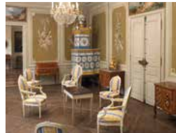
Une heure chez les Beurnier-Rossel à la fin du XVIII e siècle : le musée d'art et d'histoire - Hôtel Beurnier-Rossel 🕒 1h30 📍 Montbéliard

Les musées de Montbéliard possèdent de riches collections dont celles d'archéologie gallo-romaine consacrées aux découvertes du site antique de Mandeuve, et celles de la Galerie Cuvier dédiée aux travaux du grand savant, père de la paléontologie moderne, né à Montbéliard en 1769.