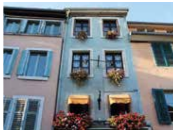
Circuit pour personnes à mobilité réduite et en situation de handicap 🕒 1h 📍 Montbéliard

En 12 étapes sur 3 km, découvrez l'œuvre de ce grand architecte wurtembergeois (1558-1635) au service du duc Frédéric, qui sut transformer la capitale médiévale en une cité princière de la Renaissance.