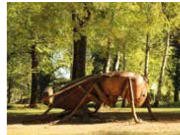
Du parc historique du Près-la-Rose à l'île en Mouvement 🕒 1h30 📍 Montbéliard

Plongez au cœur du temple du football, le stade de 20 000 places construit en l'an 2000 vous ouvre ses coulisses: tribunes, loges, salle de presse... et vous raconte son histoire liée à celle de Peugeot et du Football Club Sochaux-Montbéliard.