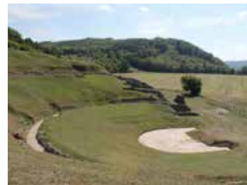
Le théâtre gallo-romain 🕒 1h30 📍 Mandeuve

Cet hôtel particulier ressuscite l'atmosphère feutrée des salons bourgeois de la fin du XVIII e . Ses buffets montbéliardais, commodes en marqueterie, étains liturgiques, coiffes perlées, boîtes à musique, étoffes en verquellure... évoquent le double héritage germanique et protestant du Pays de Montbéliard.