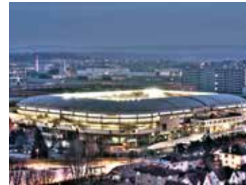
Le stade Bonal 🕒 1h 📍 Montbéliard

Plongez au cœur du temple du football, le stade de 20 000 places construit en l'an 2000 vous ouvre ses coulisses: tribunes, loges, salle de presse... et vous raconte son histoire liée à celle de Peugeot et du Football Club Sochaux-Montbéliard.