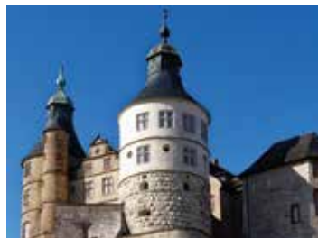
Château des Ducs de Wurtemberg : circuit historique des tours 🕒 1h30 📍 Montbéliard

Visite adaptée du cœur historique, sur un parcours sans dénivélé.