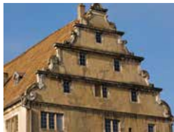
Sentier urbain « Heinrich Schickhardt et son temps » 🕒 1h30 📍 Montbéliard

Laissez-vous conter l'histoire de la cité des princes, blottie au pied de son château. Parcourez quatre siècles d'un singulier destin sous le règne des Wurtemberg.