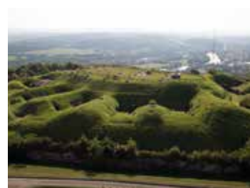
Le fort du Mont-Bart entre ciel et ténèbres 🕒 1h30 📍 Bavans

L'un des plus grands théâtres des Gaules (146 m de diamètre) raconte le passé prestigieux de l'agglomération antique d' Epomanduodurum . La visite dévoile 4 étages de gradins et 20 siècles d'histoire. La visite peut être complétée par celle des collections d'archéologie gallo-romaine du musée du château des ducs de Wurtemberg.