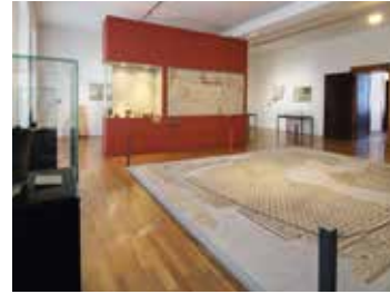
Château des Ducs de Wurtemberg : paléontologie et archéologie au musée 🕒 1h30 📍 Montbéliard

L'ancienne résidence des comtes de Montbéliard, ducs de Wurtemberg, vous livre les secrets de celles et ceux qui ont vécu dans ses tours: la comtesse Henriette, le prince Frédéric, le duc Léopold Eberhardt, et la princesse Sophie-Dorothee pour ne citer qu'eux.