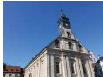
Le temple Saint-Martin et les collections religieuses du musée d'art et d'histoire - Hôtel Beurnier-Rossel 🕒 1h30 📍 Montbéliard

Cette œuvre majeure de la renaissance germanique, construite de 1601 à 1607 par Heinrich Schickhardt, est le plus ancien édifice français affecté au culte de la Réforme. La visite se poursuit au musée d'art et d'histoire - Hôtel Beurnier-Rossel avec la collection d'orfèvreries luthériennes déposées par les paroisses protestantes du Pays de Montbéliard.