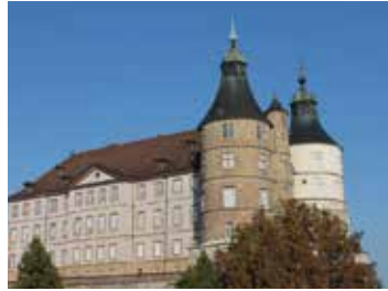
Le cœur historique de la Cité des Princes 🕒 1h30 📍 Montbéliard

Laissez-vous conter l'histoire de la cité des princes, blottie au pied de son château. Parcourez quatre siècles d'un singulier destin sous le règne des Wurtemberg.